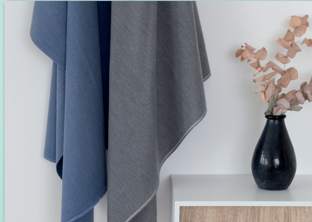
Artikel Silence 4569 | aw = 0,90